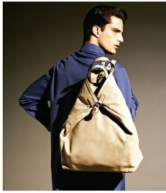
GARRY ON - GUCCI