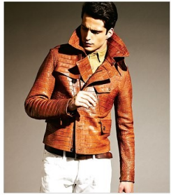
BOVIA / NEFFLE - RALPH LAUREN POURTE LABEL