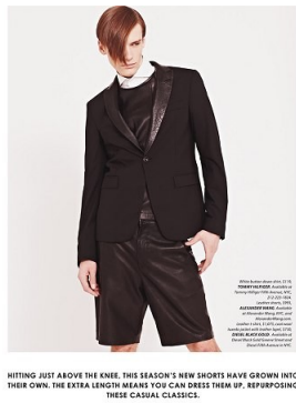
HITTING JUST ABOVE THE KNEE, THIS SEASON'S NEW SHORTS HAVE GROWN INTO THEIR OWN. THE EXTRA LENGTH MEANS YOU CAN DRESS THEM UP, REDEFINING THESE CASUAL CLASSICS.